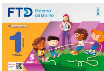
Título: Educação Infantil - 5 anos Editora: FTD